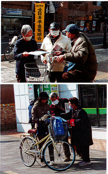
上は与野支部(与野本町駅)、下はさいたま西、見沼支部(東大宮駅)での取り組み=2月15日

15日の年金受給日に、各地で怒りを込めて街頭宣伝を行いました。足を止めて署名に応じてくれた