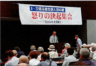
最高裁要請行動・報告集会

この年金裁判は、2012年の年金法改正で、年金を2・5%引き下げたことに端を発しています。年金者組合は、ただでさえギリギリの生活をしているところに年金を引き下げるのは憲法25条、29条、13条に違反するのではないか、と訴えたまま地裁に訴え、2016年7月に第1回口頭弁論が開かれ、以降17回の口頭弁論が開かれました。