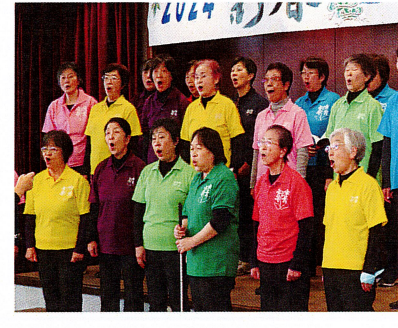
オープニングでの合唱で会場を盛り上げてくれた合唱団のみなさん