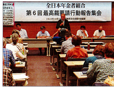
第6回最高裁要請行動報告集会Ⅱ 2023年