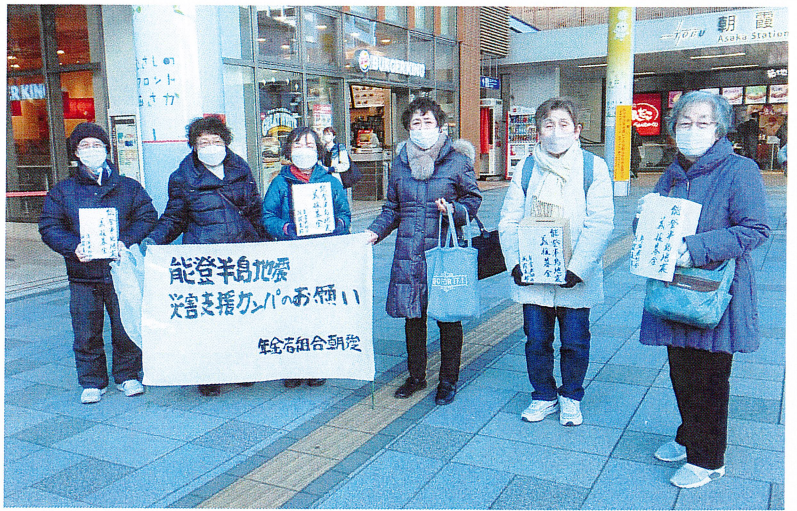
朝霞駅前で13人が集まり、能登半島地震支援募金活動に取り組んだ皆さん＝1月24日